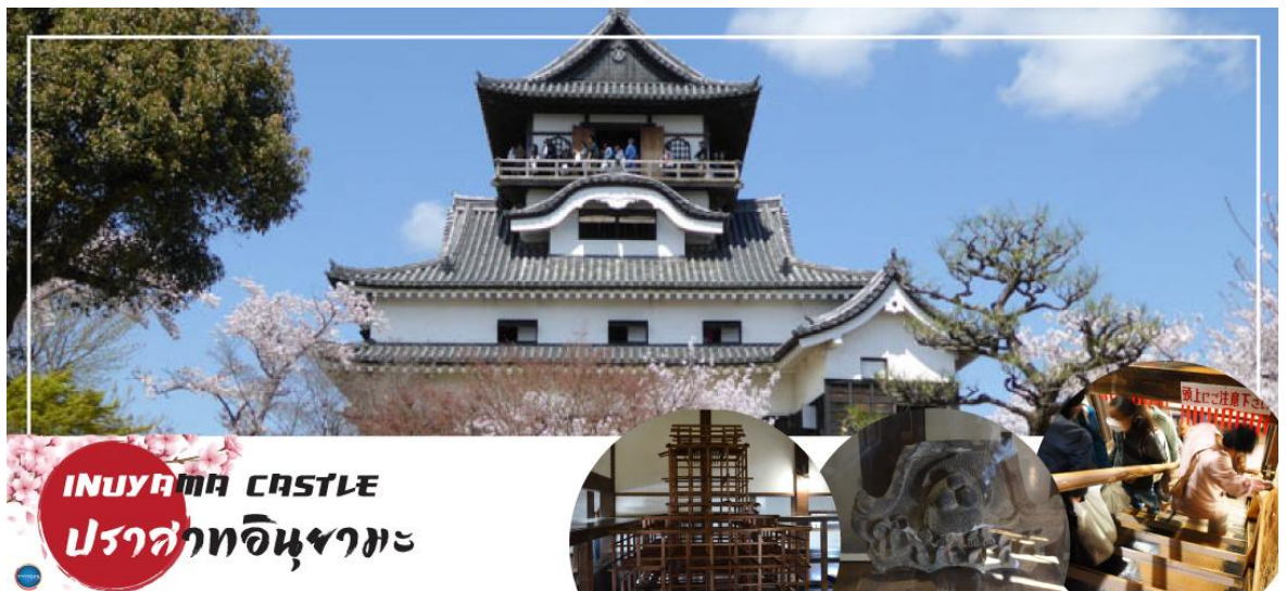
INUYAMA CASTLE ปราสาทอินยามะ

นำท่าน เข้าชม ปราสาทอินยามะ (Inuyama Castle) ตั้งอยู่ใจกลางเมืองอินยามะ ทางตะวันตกเฉียงเหนือของจังหวัดไอจิ ประเทศญี่ปุ่น เป็นปราสาทที่สร้างขึ้นในตอนปลายศตวรรษที่ 16 ที่อยู่รอดมาจนถึงปัจจุบัน ปราสาทแห่งนี้มีความพิเศษตรงที่มีหอคอยที่มีความเก่าแก่ที่สุดในประเทศ ดังนั้นปราสาทแห่งนี้จึงได้รับการประกาศให้เป็นสมบัติของชาติ ด้านในของปราสาทมีการจัดแสดงอาวุธในการทำสงครามในสมัยต่าง ๆ ของญี่ปุ่น และเราสามารถเดินขึ้นไปด้านบนเพื่อชมความงามของตัวเมืองอินยามะ ตลอดจนแม่น้ำคิโซะ และที่ราบโนบิได้