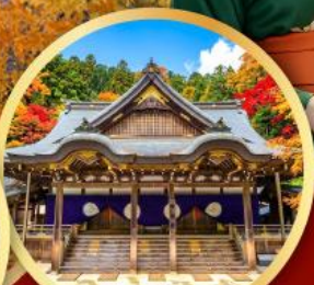
ศาลเจ้าอิสะ