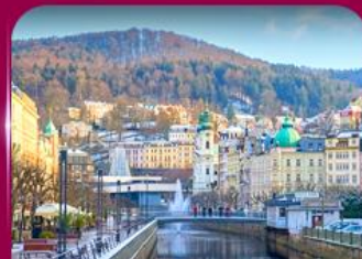
เมืองสปาแสนสวย คาร์โลว วารี