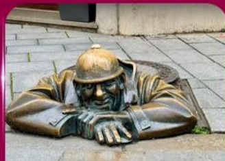
เซลฟี่คูคูมิลา บราติสลาวา