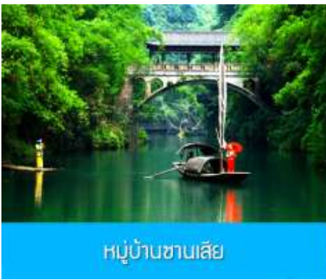
หมู่บ้านซานเสี