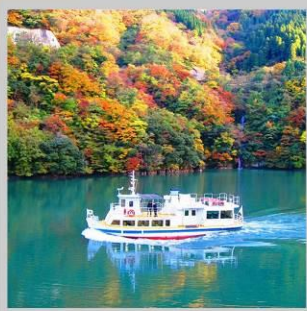
“SHOGAWA YURAN CRUISE”