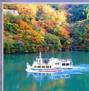
"SHOGAWA YURAN CRUISE"