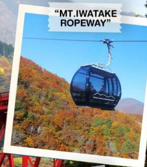
"MT. IWATAKE ROPEWAY"