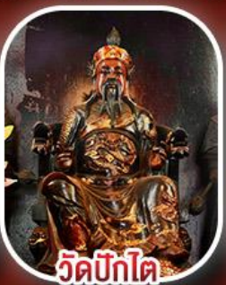
วัดปึกไต่