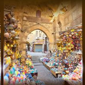
ตลาดฟานเวลกาลลี