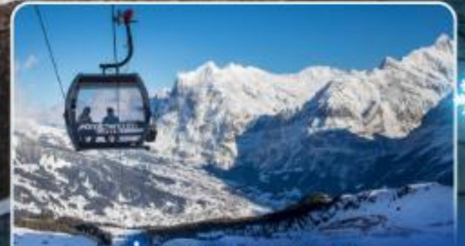
นั่งกระเช้าและรถไฟสุด อลเวงจากจุงเฟรา