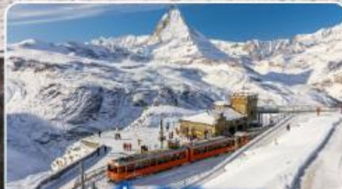
นั่งรถไฟสุดอลเวง กรอนเนอ์เกรต