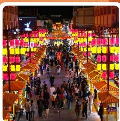
ตลาดกลางคีนซาโจว