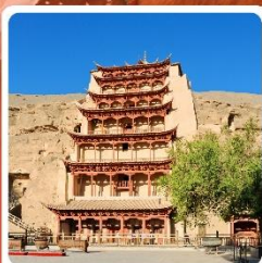
กำมั่วเกาตุ