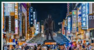
ถนนแดนแดนเซี่ยงชู่