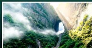
เขาประตูลี้สวรรค์