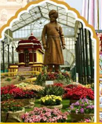
บั้งกาลอรล