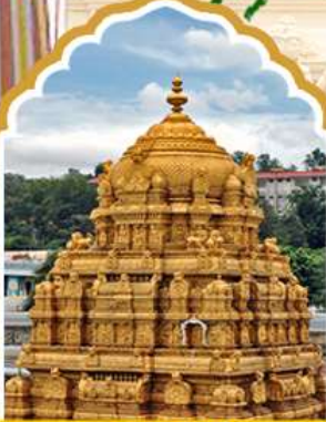
ตลรัปาดล