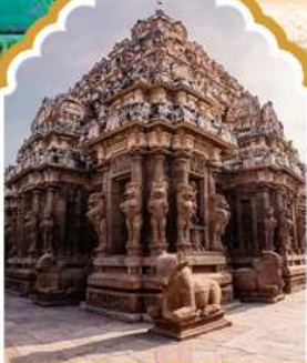
กาญจัปรัม