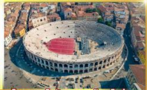
โรงละครโรมันกลางจัหวโรม่า