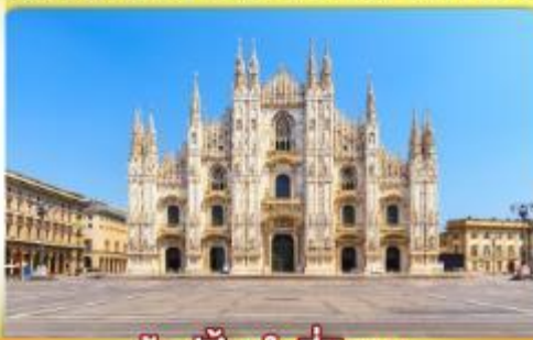
ซอปป์ิงจู่ที่มีลาน