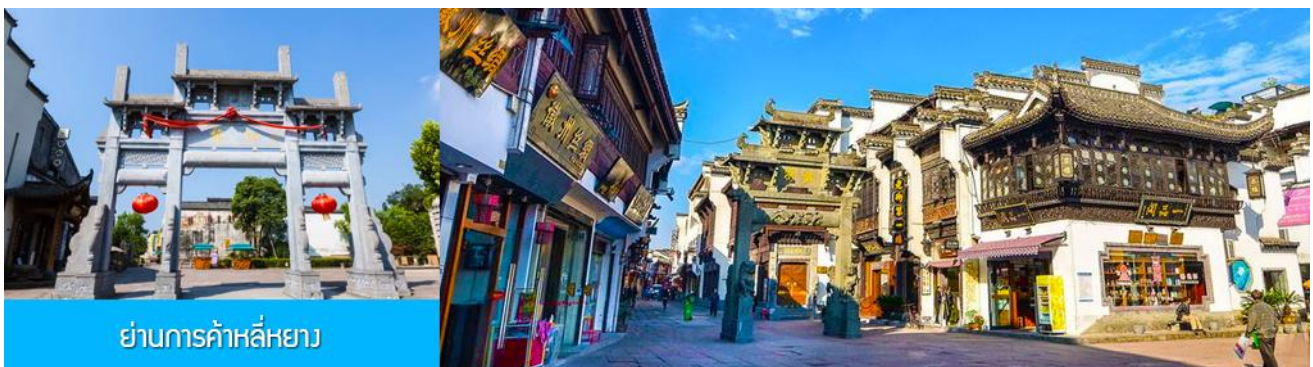
ย่านการค้าหลี่หยาง