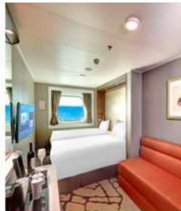
Oceanview Stateroom with Window