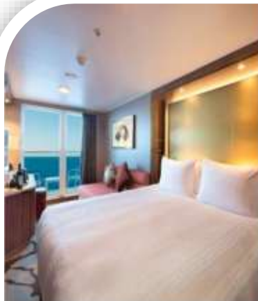
Oceanview Stateroom with Balcony