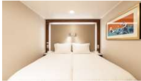
พัก 1-2 ท่าน

From 13 - 14 sq.m Max Occupancy 2-4 A Deck 5/8/9/10/11/12/13/15 2 Single Beds / 2 Single Beds + 1 Ceiling Pullman Bed / 1 Single Bed + 1 Pullman Bed + 1 Double Sofa Bed